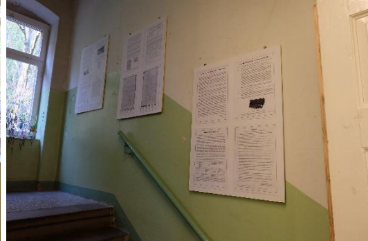
Ausstellungstafeln zur Frühgeschichte der Textilfabrik 2019 im Treppenhaus der Schauweberei.