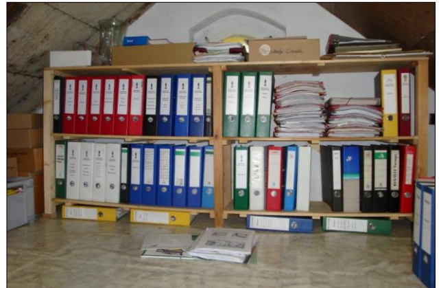
Der Umfang der Braunsdorfer Chronik im Jahr 2010.