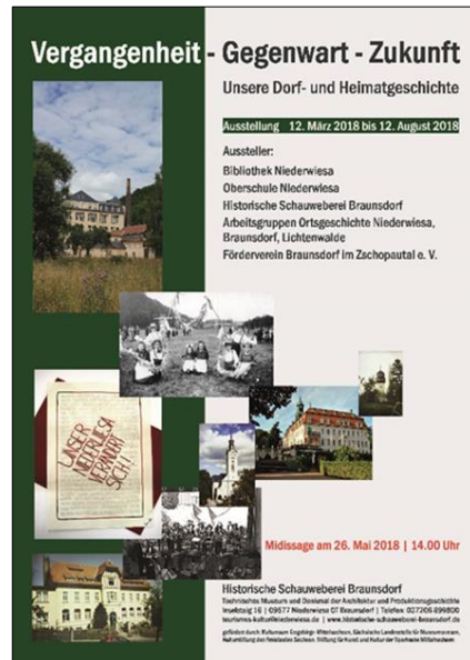
Plakat zur Ausstellung 2018

Textilstandort im 19. Jahrhundert überließ er dem Museumsarchiv eine mehrere Ordner umfassende Quellensammlung. Zur Abschlussveranstaltung am 10. August zeigte Heiko Lorenz im Rahmen eines Diavortrages in 239 Bildern das gesamte kulturelle Leben Braunsdorfs. Zu dieser hochgelobten Veranstaltung fanden sich gut 40 Interessierte ein.