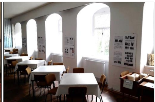
Links Ausstellungstafeln zur Frühgeschichte der Textilfabrik 2018 in der Schauweberei. Rechts Ausstellungstafeln zur Kultur Braunsdorfs 2018 in der Schauweberei.