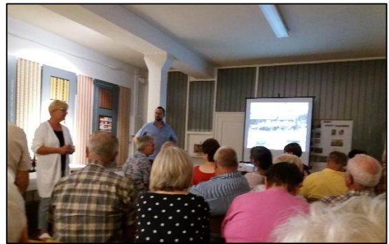
Vortrag am 10. August 2018